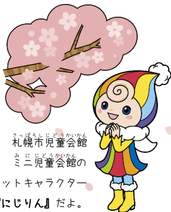
札幌市児童会館 ミニ児童会館の マスコットキャラクター 『にじりん』だよ。